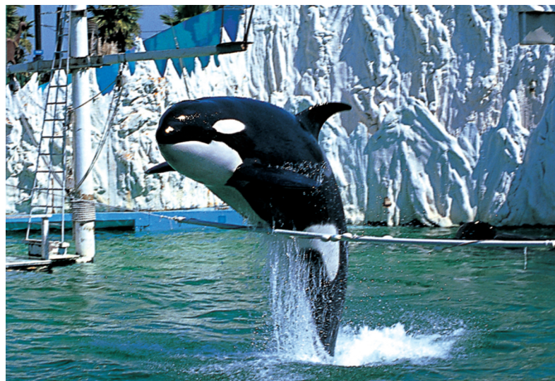
Figura 4 Nell'addestramento degli animali, come i delfini e le orche, si fa spesso uso del condizionamento operante. In seguito a una serie di ricompense, che agiscono da rinforzo, l'animale impara a ripetere in modo preciso un certo tipo di comportamento.

• Comportamento intelligente: è la capacità di risolvere un problema senza poter fare affidamento su precedenti prove ed errori, come nei due casi precedenti; è una vera e propria forma di ragionamento che si verifica solo nei primati e nei vertebrati più evoluti (Figura 5).