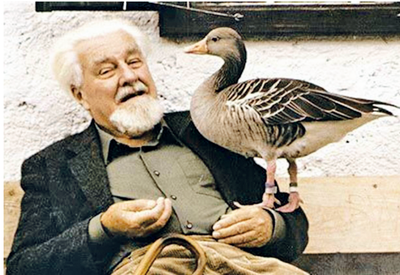
Figura 3 Lorenz stesso si sostituì alla madre durante il periodo critico e gli anatroccoli iniziarono a seguirlo.

• Apprendimento associativo: in seguito all'esperienza, uno stimolo è collegato a un altro stimolo. Classici sono stati gli studi condotti negli anni Venti del secolo scorso dal fisiologo russo Ivan Pavlov (1849-1936). In un suo famoso esperimento, egli offrì ripetutamente del cibo a un cane affamato segnalando all'animale l'arrivo del cibo mediante il suono di un campanello.