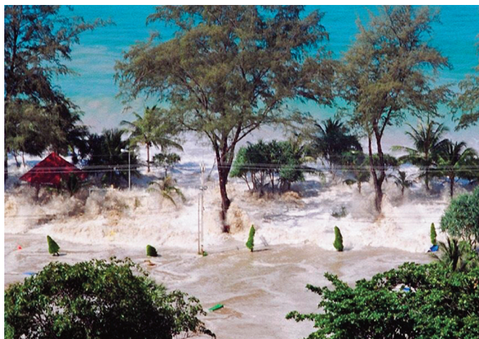
Figura 1 Gli tsunami sono provocati da terremoti sottomarini che determinano un violento sollevamento della massa d'acqua.

(Alcune parti di questo approfondimento fanno riferimento ai contenuti del sito: http://www.scienzagiovane.unibo.it/tsunami.html )