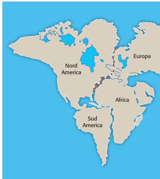
Figura 1 Gli Appalachi della costa orientale del Nord America, i monti della Scozia e le Alpi Scandinave sono allineati tra loro e coevi (400 milioni di anni circa).

• Poiché Wegener era un meteorologo, le prove più consistenti sono quelle basate sulla distribuzione dei climi nel passato. Egli in particolare studiò le tilliti, depositi che indicano la posizione di antichi ghiacciai. Tali formazioni si ritrovano oggi in regioni anche molto lontane dai Poli (Figura 2). Esse sono probabilmente il risultato di una grande glaciazione avvenuta nell'emisfero antartico quando tali regioni erano riunite insieme. Successivamente esse sono state trasportate dai continenti in aree climatiche completamente differenti.